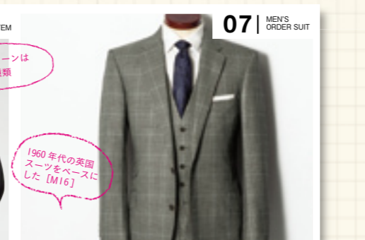
07 | MEN'S ORDER SUIT