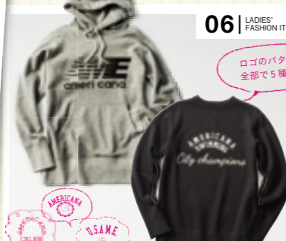
06 | LADIES' FASHION ITEM