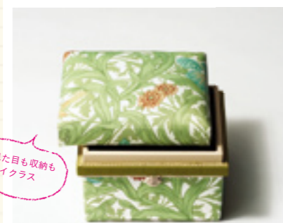
03 | LIVING ITEM