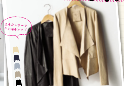
02 | LADIES' LEATHER JACKET