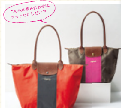
01 | LADIES' COLOR ROCK BAG