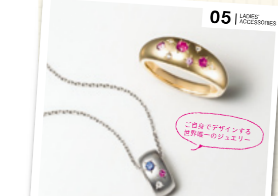
05 | LADIES' ACCESSORIES

04. エlegantな革アイテムで人気の(カミュー・フォルネ)では、6種のバッグに革小物、ベルトの素材や色をお選びいただけます。 (カミュー・フォルネ)パターンオーダー会 バッグ 135,000円から 財布・革小物 54,000円から ■6階 カミュー・フォルネ Order Point Material:皮革約6種(牛革、トカゲ革、アリゲーター革、オストリッチ革など) Color: 約100色(表地、裏地、それぞれ別色可能) Item: バッグ6種(トートバッグ、ドキュメントケース、クラッチバッグ、婦人バッグほか)、革小物(名刺入れ、キーケース、長財布ほか)、ベルト ※お渡し期間:約6カ月後