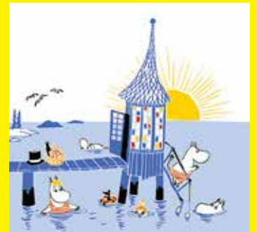
「ちびのミイがやってきた!」彩色原稿