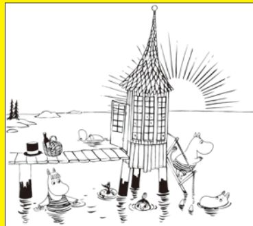
「ちびのミイがやってきた!」下絵原画