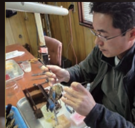
地の利を生かし、品質に妥協しない真珠を生産者自らお届けいたします。