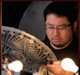
伝統の技と現代の感覚の調和、温故知新の精神で薩摩切子を生み出しております。

【鹿児島県】薩摩びどろ工芸 洗練されたカットの幾何学模様が織り成す「切子の美」。「吹き師」と「切子師」による培われた技術と経験によって生み出された逸品です。底を上に向けてみると「桜島」が雄大な姿を現します。 2014年新作 薩摩黒切子「桜島」 ……………各 21,600円 クリスタルガラス、口径7×高さ4cm