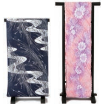
左) 笠仙ゆかた地 78,840円 綿100%、日本製

採寸をして、自分サイズにオーダー される浴衣の着心地。 シルエットの良さ。三越ならではの 縫製技術で、ジャストサイズの 浴衣をつくりませんか。