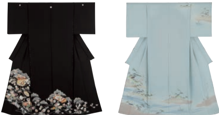
左)京友禅黒留袖 右)「上野為二」訪問着 各216,000円