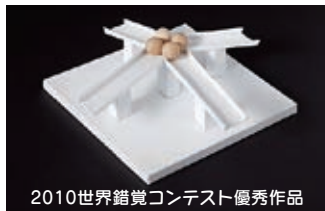
2010世界錯覚コンテスト優秀作品