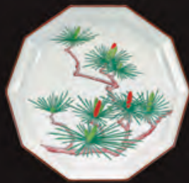
濁手 松文 皿 (径30.8×高さ4.7cm) 648,000円