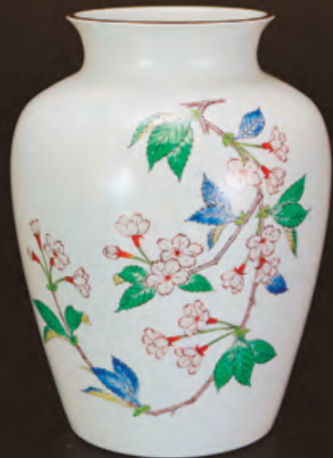
濁手 桜文 花瓶 (径20.7×高さ27.3cm) 1,296,000円

1968年 佐賀県有田町生まれ 1991年 多摩美術大学絵画学科中退 1994年 十四代柿右衛門に師事 2010年 第45回西部伝統工芸展にて初入選 第57回日本伝統工芸展にて初入選 2013年 重要無形文化財保持団体「柿右衛門製陶技術保存会」会長に就任 第48回西部伝統工芸展にてKAB熊本朝日放送賞受賞 2014年 十五代酒井田柿右衛門襲名 現在 日本工芸会西部支部幹事、 佐賀県陶芸協会会員、有田陶芸協会会員、 九州産業大学大学院芸術研究科客員教授