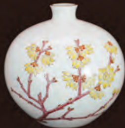
濁手 唐梅文 瓶 (径20.2×高さ19.7cm) 540,000円