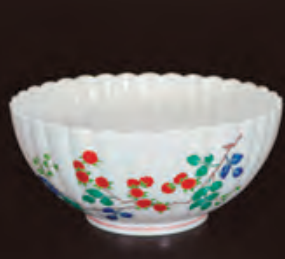
濁手 母文 菊形鉢 (径25.2×高さ11.4cm) 756,000円