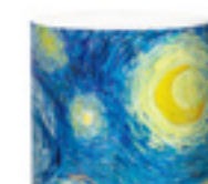
(MoMA DESIGN STORE) スターナイト マグカップ 1,944円 直径8x高さ9.5cm □3階 銀座テラス/テラスコート