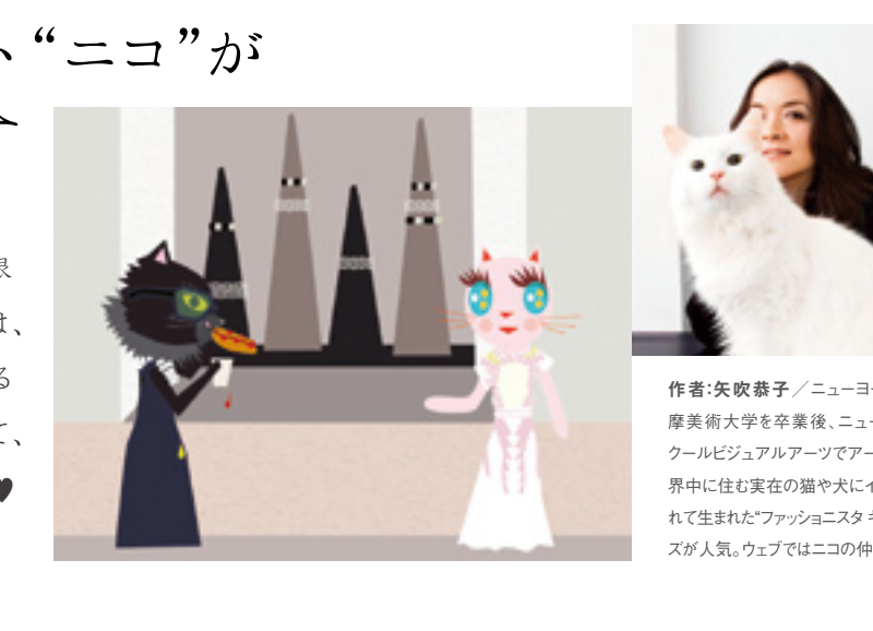
作者:矢吹静子/ニューヨーク在住。多摩美術大学卒業後、ニューヨークのスクールビジュアルアートでアートを学ぶ。世界中にまたたく間にインスパイアされて生まれた「ファッションista キャット」シリーズが人気。ウェブではニコの仲間も登場。

ンなして思いきり解放できる場所。銀座三越『ニューヨークウイーク』には、まさに現地の最旬アイテムが揃ってるわ! こんなに一気に楽しめるなんて、住んでいる私もうらやましいくらい! 思いきり楽しんでね!」